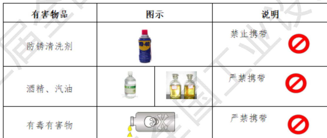
表 6 选手禁带的物品