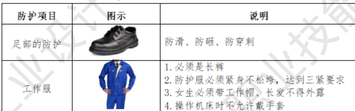
表 5 选手的防护装备

全国大赛时，裁判员可对违反安全与健康条例、违反操作规程的选手和现象提出警告并进行纠正。不听警告，不进行纠正的参赛选手会受到罚分、停止加工、直至取消竞赛资格等不同程度的惩罚。