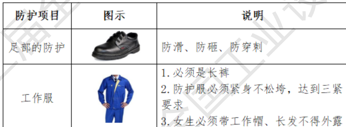
表 7 选手的防护装备