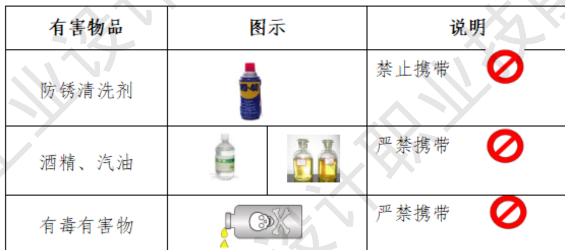
表 8 选手禁带的物品